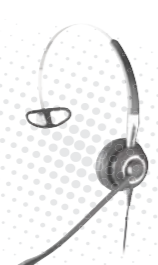
콜센터용 헤드셋 BIZ2400 MONO