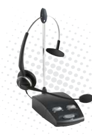
콜센터용 유선헤드셋 GN8000 / GN2120