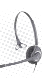
콜센터용 헤드셋 HW451N