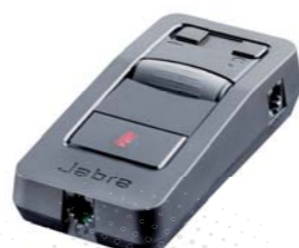
USB전원 초소형 디지털 다기능 앰프