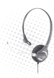
콜센터용 헤드셋 HW451